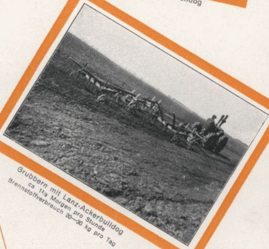
Grubbern mit Lanz-Ackerbulldog ca. 1 1/2 Morgen pro Stunde Brennstoffverbrauch 20-30 kg pro Tag