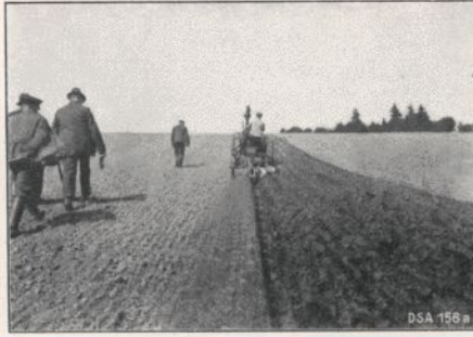
Saatfurche mit Lanz-Ackerbulldog ca. 1 Morgen pro Stunde. Brennstoffverbrauch 20-30 kg pro Tag