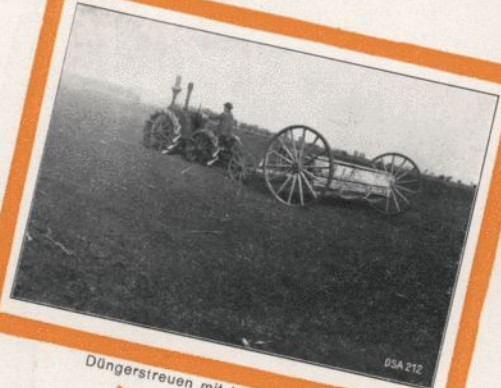
Düngerstreuen mit Lanz-Ackerbulldog